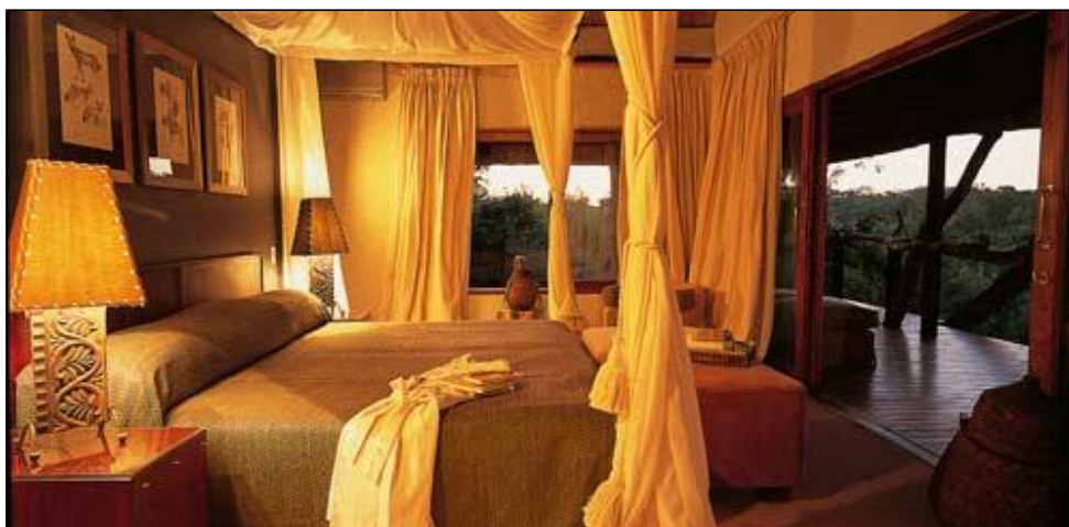
Luxuriöse Unterkünfte in Südafrika

Die privaten Tierreservate insbesondere im Ostteil des Landes sind für den Tierreichtum und den hohen Standard bezüglich Unterkunft und Service bekannt. Von professionellen Guides begleitet fahren Sie zumeist in offenen Geländewagen auf Pirsch. Der permanente Funkkontakt und Informationsaustausch unter den Rangern ermöglicht es Ihnen, auch bei kürzeren Aufenthalten, selbst so scheue Tiere wie Leoparden und Nashörner aufzuspüren. Die hier angebotenen Nachtpirschfahrten stellen eine spektakuläre Safari- Variante dar. Wir empfehlen insbesondere die nachfolgend aufgeführten Tierreservate und Lodges.