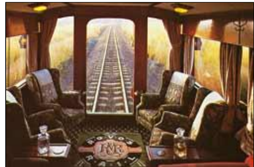
Rovos Rails Abteil

(Fordern Sie unseren ausführlichen Sonderprospekt an!)